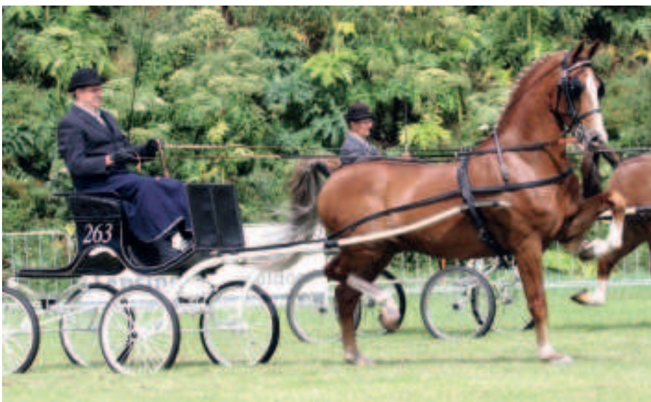
Wonder van de Ursahof behoort met 246 winstpunten bij de toppers van Patijn.