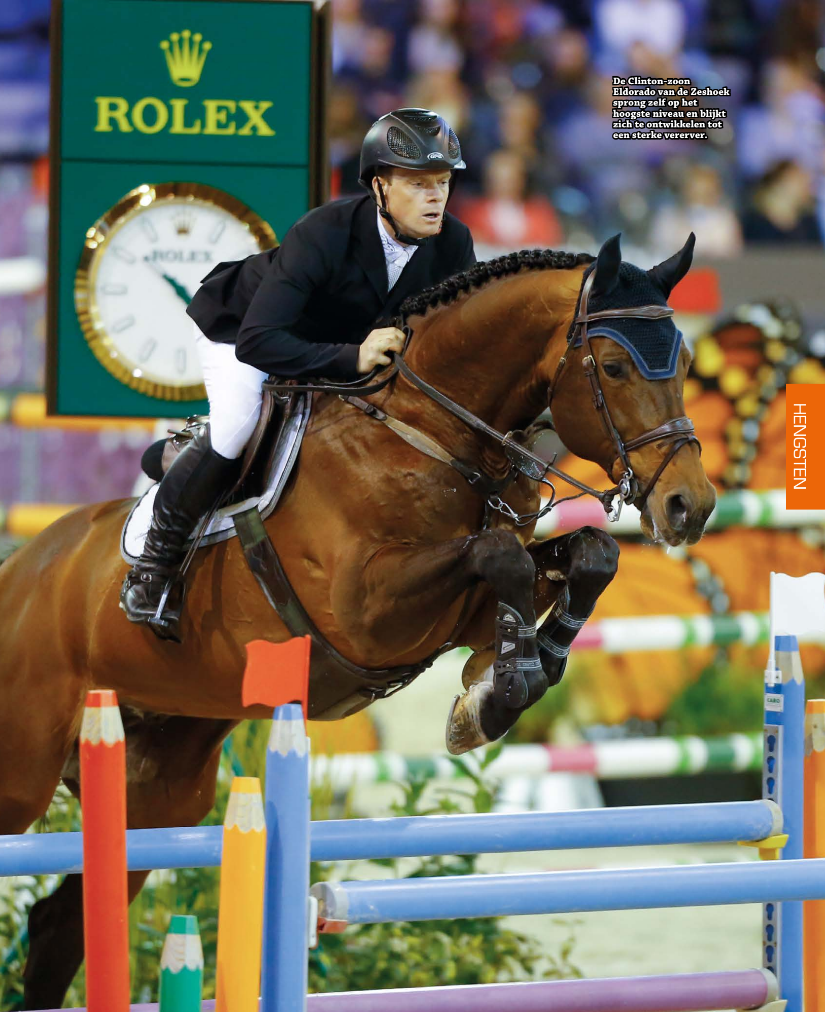
De Clinton-zoon Eldorado van de Zeshoek sprong zelf op het hoogste niveau en blijkt zich te ontwikkelen tot een sterke vererfer.