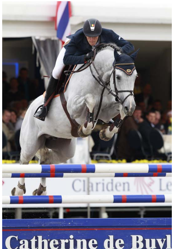
Een opvallende Berlin-nazaat is deze spectaculair springende hengst Zilverstar T, die in de Youngster Tour en het internationale 1.40m resultaten boekt.