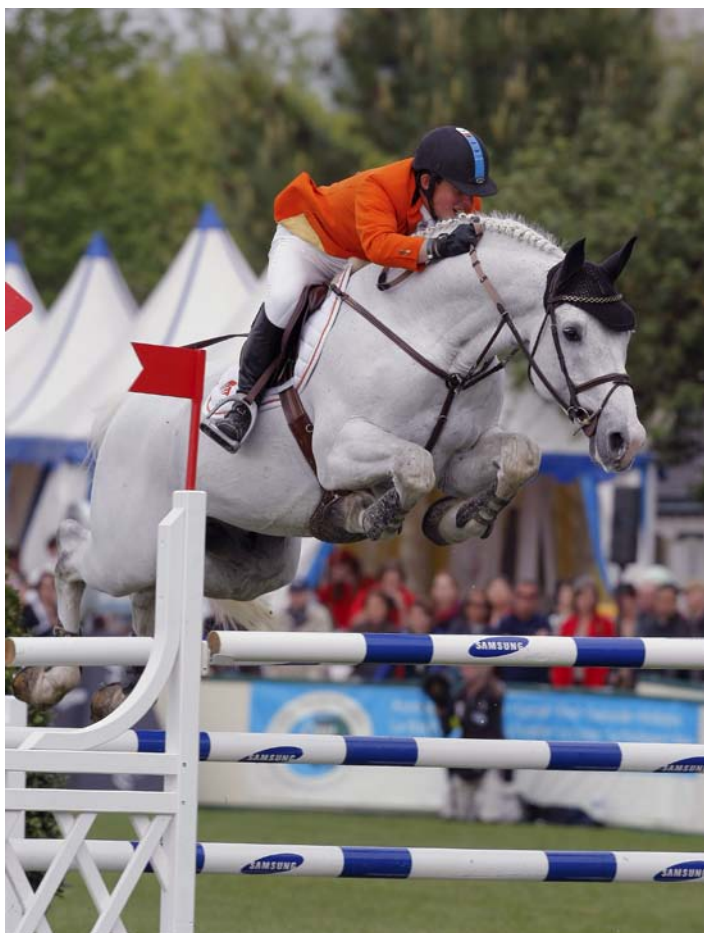
Na een zeer succesvolle carrière op het hoogste niveau in de sport lijkt Berlin zich nu ook te onderscheiden in de fokkerij. Zijn oudste producten vallen op in de Youngster Tour en internationale sport.