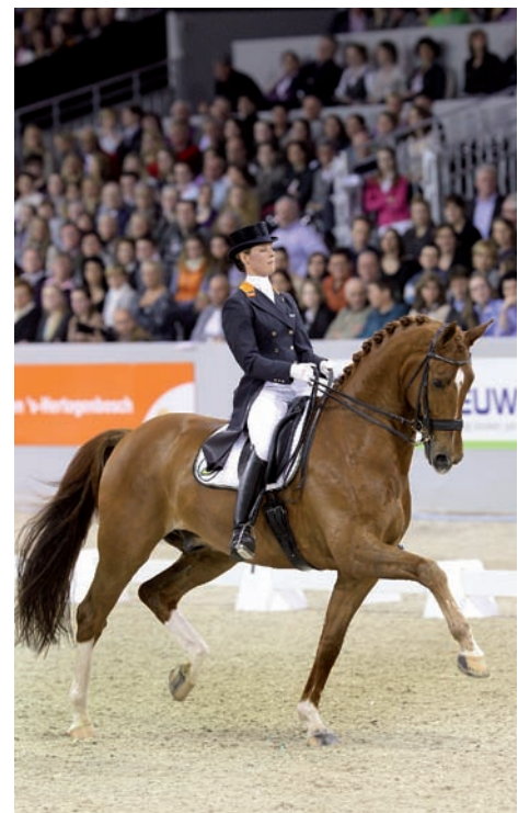
Ongetwijfeld de meest bekende Jazz-zoon is onze nationale trots Parzival, die onder Adelinde Cornelissen vele successen boekt.