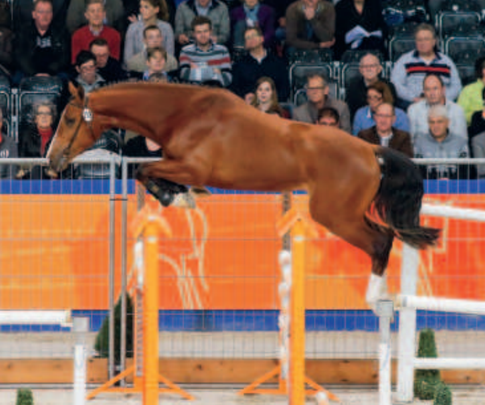
Vorig jaar werd de Opium-zoon Fridus (mv. Corleone) aangewezen voor het KWPN-verrichtingsonderzoek.

concours in Aken, uniek!” Tot op heden zijn er in totaal 64 nakomelingen van Opium bij het KWPN geregistreerd.