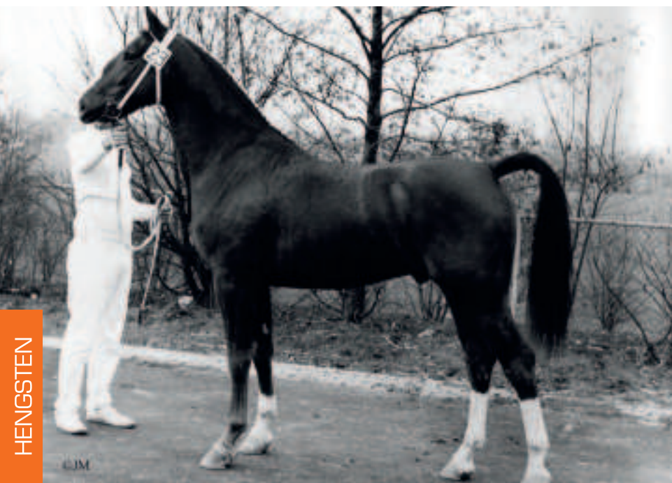
Proloog verstevigde de klassieke fundering die zijn voorvaders legden.

tractoren het veelzijdige landbouwpaard. Daarnaast kwam in die periode de paardensport op gang, zodoende veranderde ook het fokdoel.