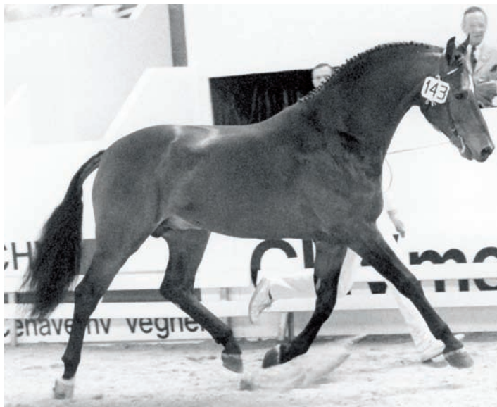
De in 2006 overleden keurhengst Wolfgang tekende voor het vaderschap van Oscar.