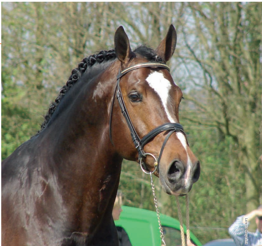
Oscar (Wolfgang x Nabuur).