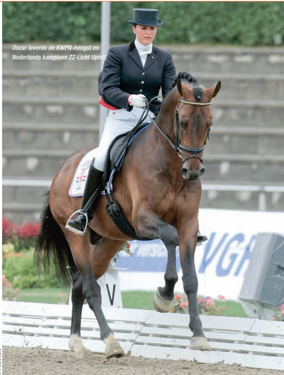
Oscar leverde de KWPN-hengst en Nederlands kampioen ZZ-Licht Uphill.