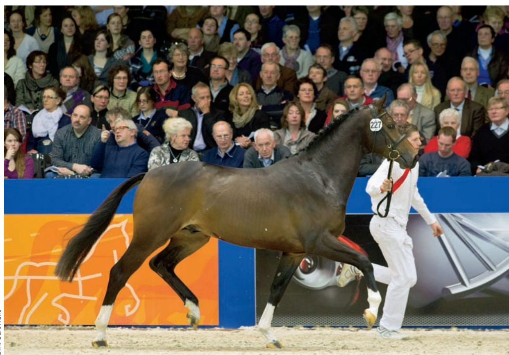
Dit jaar werd wederom een zoon van Padinus aangewezen voor het verrichtingsonderzoek. Deze Ericson is een halfbroer van de KWPN-goedgekeurde hengst Whistler (v.Holland).