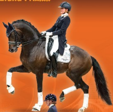
• Apache • v. UB40 x Krack C