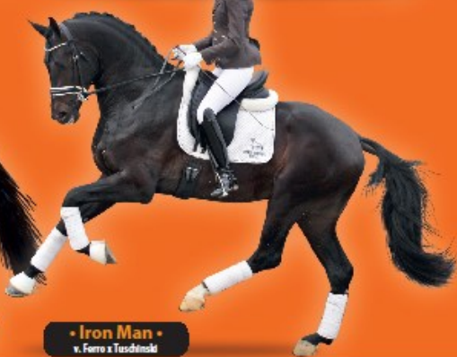
• Iron Man • v. Ferro x Tuscandoli