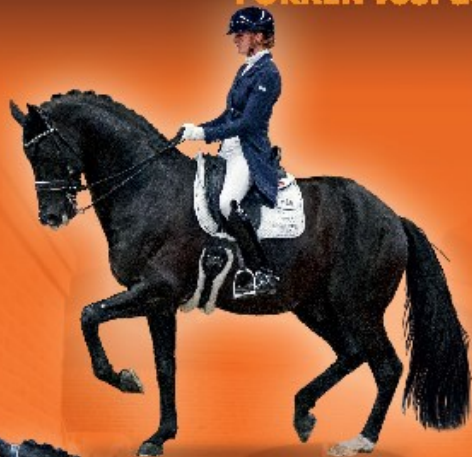
• Desperado • v. Vivaldi x Haridoff