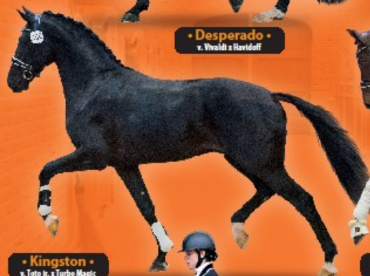
• Kingston • v. Toto jr. x Turbo Magic