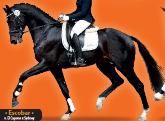
• Escobar • v. B Capone x Sydney