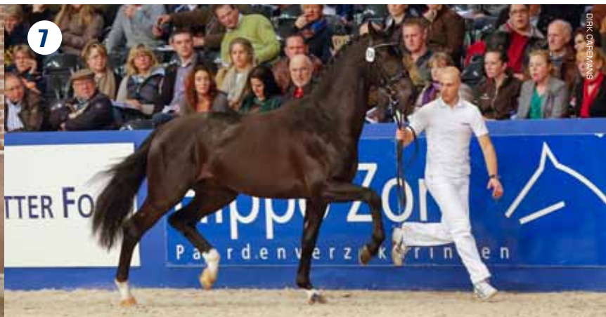
6. VSN-Trofee winnaar Atomic is een zoon van Ampère (mv.Tolando). 7. Ook in de kampioenskeuring 's-Hertogenbosch: Fellini (mv.Jazz).

mijn gevoel omdat hij in shows en dergelijke als jong paard overvraagd is. Dat is altijd een groot gevaar als je een fantastisch jong paard hebt. Wij hebben het eerste jaar heel rustig aan gedaan. Veel buiten gereden in het bos, zonder enkele druk erop. Niets moest. Ook geen shows. Van daaruit zijn we hem langzaam op gaan bouwen. Maar nog altijd wisselen we het buiten rijden en trainen veel af. Hij is nu gelukkig weer een 'happy horse'. Als we hem op een show voorstellen, doen we dat op een relaxte manier. Dus geen uitgestrekte draf en passage-achtige toestanden meer. De hengst heeft dat ook helemaal niet nodig om op te vallen. Het lag in de bedoeling dat hij voor de sport zou worden opgeleid. Maar de nakomelingen van Ampère doen het zo goed, dat hij zeer gevraagd is als dekhengst. Niet alleen hier in Zweden, maar ook in Duitsland, Nederland... Eigenlijk krijgen we aanvragen vanuit de hele wereld. Daarom hebben we recent in goed overleg besloten, de fokkerijloopbaan voor te laten gaan, en Ampère vooralsnog niet in de wedstrijd sport uit te brengen, maar gewoon thuis door te trainen", legt de dressuurruiter uit.