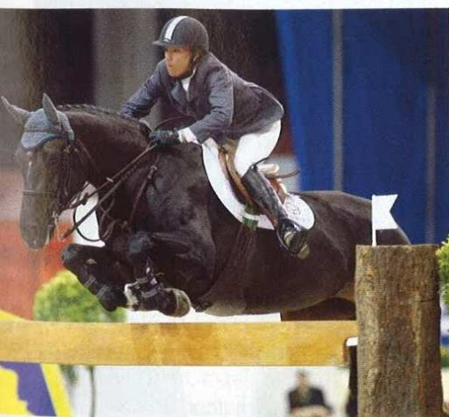
Nocturnal (v.Indorado) was reservekampioen van de zeven- en achtjarige springpaarden van de Oostkust in Amerika en kampioen van de zeven- en achtjarige springpaarden in Wellington.

"We hebben Indorado als veulen gekocht. Hij was ook als veulen grootramig met veel