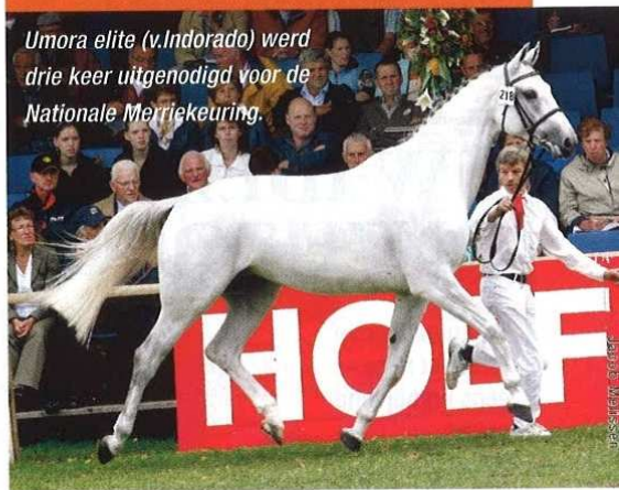
Umora elite (v.Indorado) werd drie keer uitgenodigd voor de Nationale Merriekeuring.