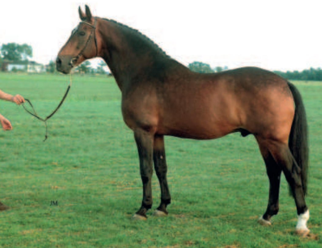
Farn is met name via zijn zoon Nimmerdor heel invloedrijk gebleken. Deze topvererver komt binnenkort aan bod in deze serie.