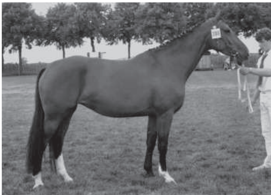
De Farn-dochter Aralda (foto) staat aan de basis van het internationale topspringpaard Fighting Alpha (v.Frühling), de internationaal springende KWPN-goedgekeurde hengst Vigaro (v.Tangelo van de Zuuthoeve) en de KWPN-goedgekeurde tophengst Ferro (v.Ulft).

Marco Polo kreeg bij zijn komst in Surhuisterveen voornamelijk merries te bedienen die afstamden van Sinaeda, veelal in combinatie met Commandeur, en Farn. Beide hengsten hadden daarmee de omvorming ingezet en met de bloedgemaakte Marco Polo kon de volgende stap gezet worden. Sinaeda was voor zijn tijd erg groot met een stokmaat van 1.68m, hij had veel front, een sterke ruime draf en een pijpomvang van 24,5 cm. Eigenschappen die Marco Polo, met zijn geringe stokmaat (1.64m), fijne beenwerk en gewone draf goed van pas kwamen. Voor Farn-merries die nog wel eens een wat eigenzinnig karakter konden hebben, bleek Marco Polo ook een goede match. Marco Polo neutraliseerde de overmaat