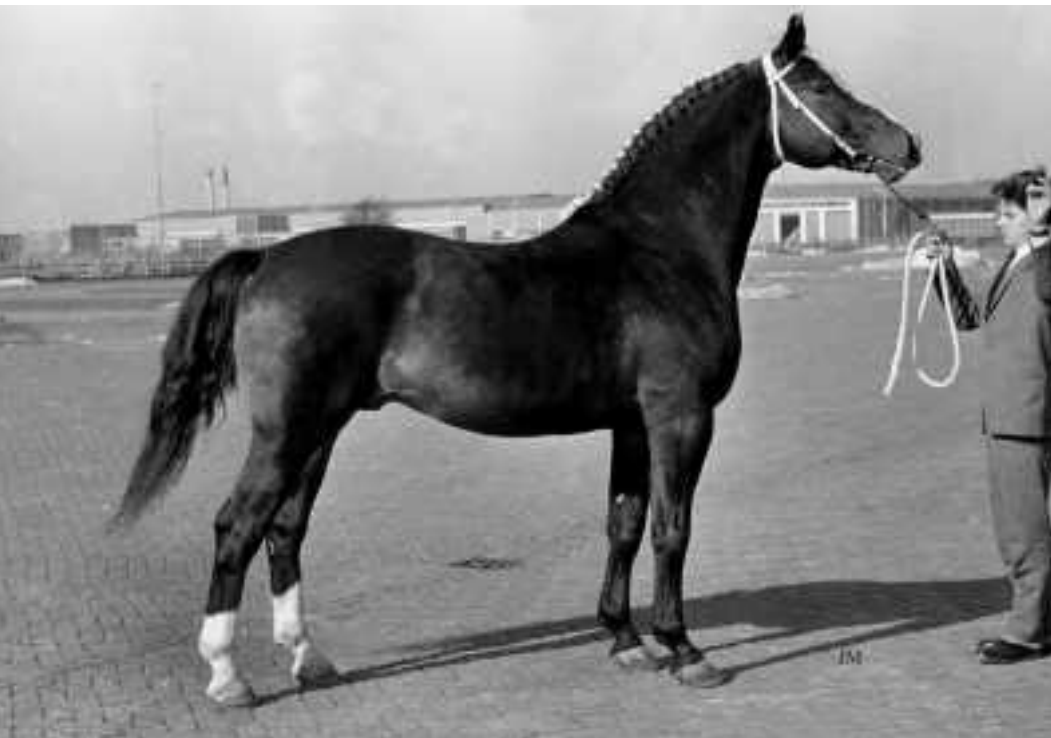
Stempelhengst Farn is van grote waarde gebleken. Hij is vader van een reeks internationale springpaarden, een heel stel uitstekende fokmerries en diverse hengsten.