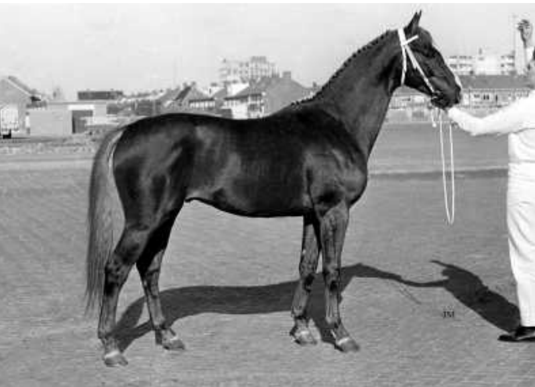
Dat de bloedgemaakte Marco Polo (v.Poet xx) veel toe wist te voegen aan de fokkerij erkenden ook de fokkers die hem in zijn beginperiode de rug toe hadden gekeerd.