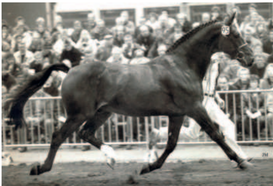
De Marco Polo-zoon Legaat is met het keurpredicaat beloond voor zijn verdiensten in de fokkerij.

in Gaasterland, waar de fokkerij niet van noemenswaardig niveau was. Uit deze periode komt wel zijn eerste goedgekeurde zoon, de in 1965 uit de Holsteiner importmerrie Towerfee (v.Gambrinus) geboren hengst Garant. Bij het NWP werd deze Farn-zoon goedgekeurd onder de naam Flipper, en later na de fusie tussen het NWP en VLN werd hij in het stamboek Gelders paard ingeschreven en keur verklaard. Garant stond ter dekking van 1968 tot 1984 en wist met name een aantal goede dochters na te laten. Na diverse verhuizingen kwam Farn in 1967 terecht bij de combinatie Kamminga/De Vries in Surhuisterveen, waar hij als vervanger van de overleden hengst Sinaeda mocht gaan optreden en zeven jaar lang ter dekking stond. In die periode heeft Farn, naar later bleek, een aantal hele goede dochters gebracht. Hij kwam naar Surhuisterveen om zijn model, massa en goed ontwikkelde fundament door te fokken, maar achteraf kan worden geconstateerd dat Farn een behoorlijke dosis springaanleg heeft weten door te geven aan zijn nakomelingen. Een schitterend voorbeeld daarvan is natuurlijk de in 1972 geboren hengst Nimmerdor, die niet alleen hengstenhouder Wiepke van de Lageweg, maar ook Nederland op de kaart heeft weten te zetten. Hij heeft internationaal gesprongen en dankt aan zijn grote prestatie in de fokkerij de titel 'Hengst van de eeuw' en zal binnenkort ook aan bod komen in deze serie.