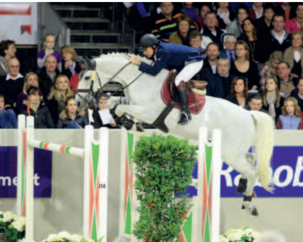
Diverse beschikbare KWPN-hengsten voeren het bloed van Sinaeda, Farn of Marco Polo. Zo ook de erkende Grand Prix-hengst Modesto, die Marco Polo en Sinaeda combineert in zijn pedigree.