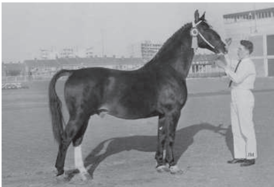
De Camillus-zoon Sinaeda is gefokt uit de Holsteinse importmerrie Morgenster en heeft een duidelijke stempel op de fokkerij gedrukt. Hij bleek een echte 'merriemaker'.

heb ik daar ook veel profijt van gehad." Met name Sinaeda en Marco Polo bleken echte 'merriemakers', ze leverden talloze waardevolle fokmerries. Dat kan ook zeker gesteld worden van Farn, die daarnaast ook enkele goede zonen bracht met de invloedrijke Nimmerdor als absolute uitschieter.