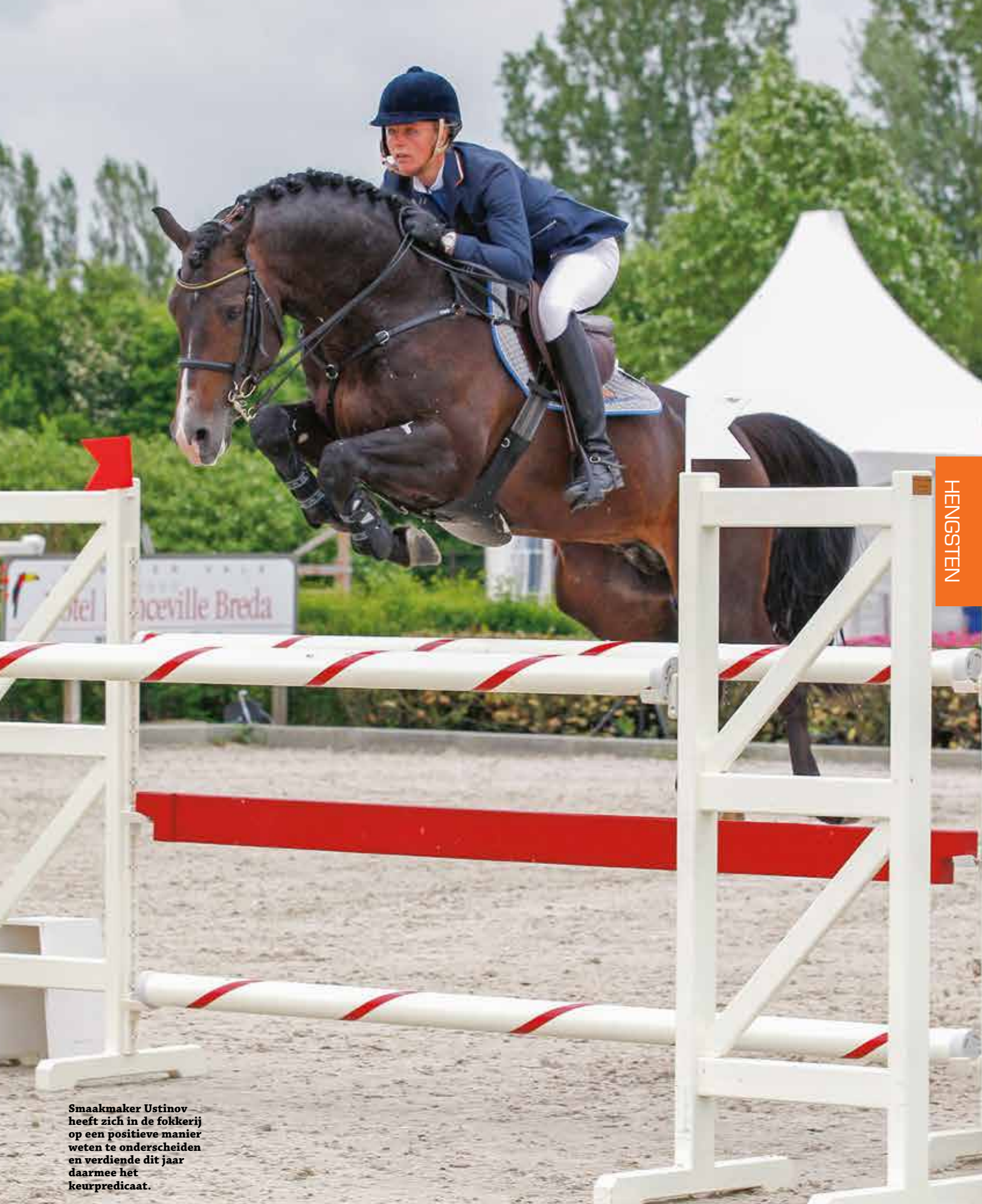
Smaakmaker Ustinov heeft zich in de fokkerij op een positieve manier weten te onderscheiden en verdiende dit jaar daarmee het keurpredicaat.