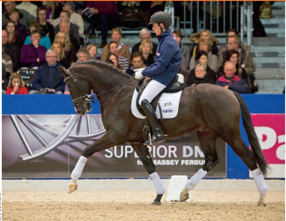
Wynton's eerste KWPN-goedgekeurde zoon is deze Dark President.