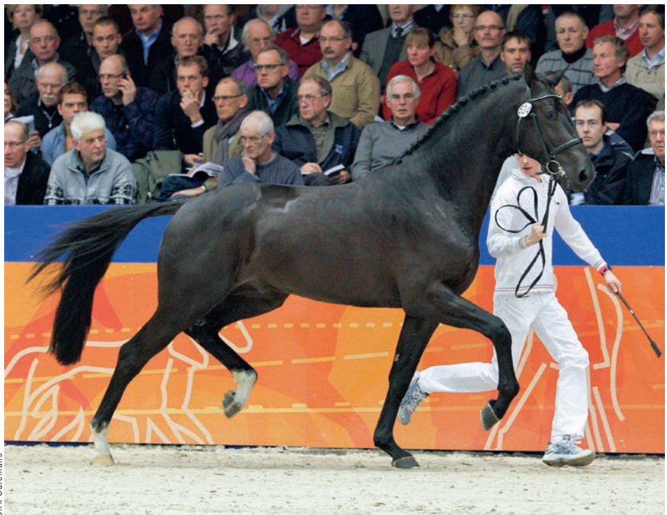
Reservekampioen van de hengstenkeuring in 's-Hertogenbosch 2012: Expo, een zoon van Wynton uit Kewriester sport-dres van Belisar.

techniek van bewegen viel vanaf het begin op. Hij toont niet alleen veel activiteit maar ook veel effectiviteit. Het achterbeen gaat iedere pas de goede kant op. Daarbij kon hij heel fijn galopperen en liet hij onder het zadel ook een hele fijne en ontspannen stap zien. Wynton is voor ons