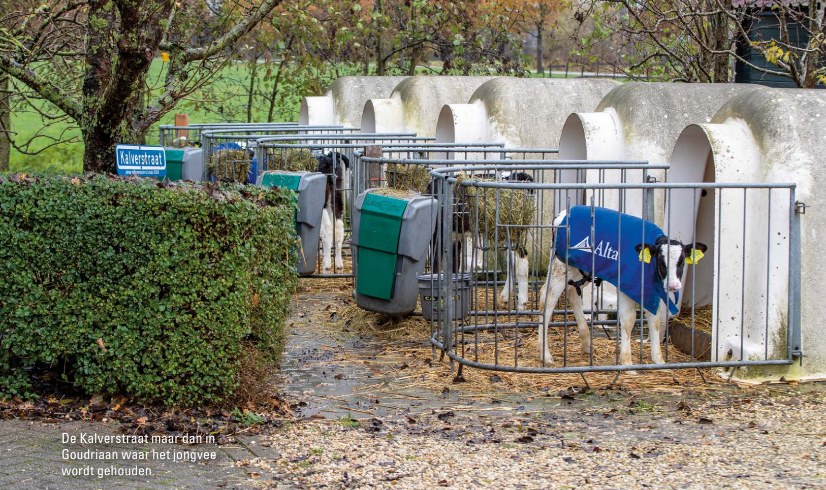
De Kalverstraat maar dan in Goudriaan waar het jongvee wordt gehouden.