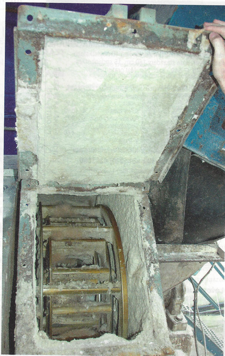
Het geheim van Agterberg: de zelf ontwikkelde mengmachine.