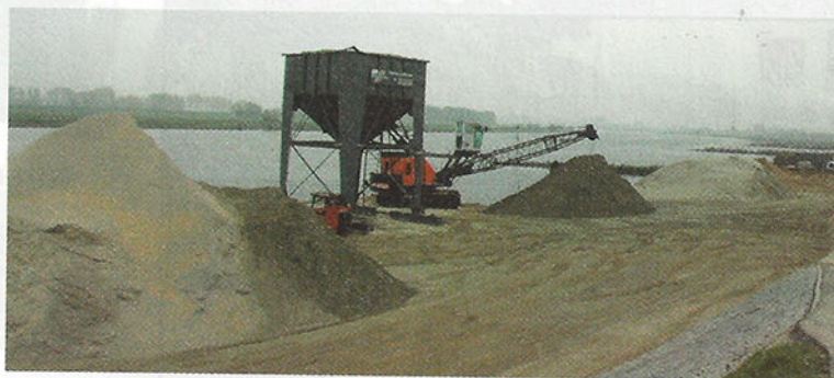
Zandaanvoer geschiedt via de Lek bij de eigen zand- en grindhandel Lekzicht bij Hagestein, met zicht op Everdingen.