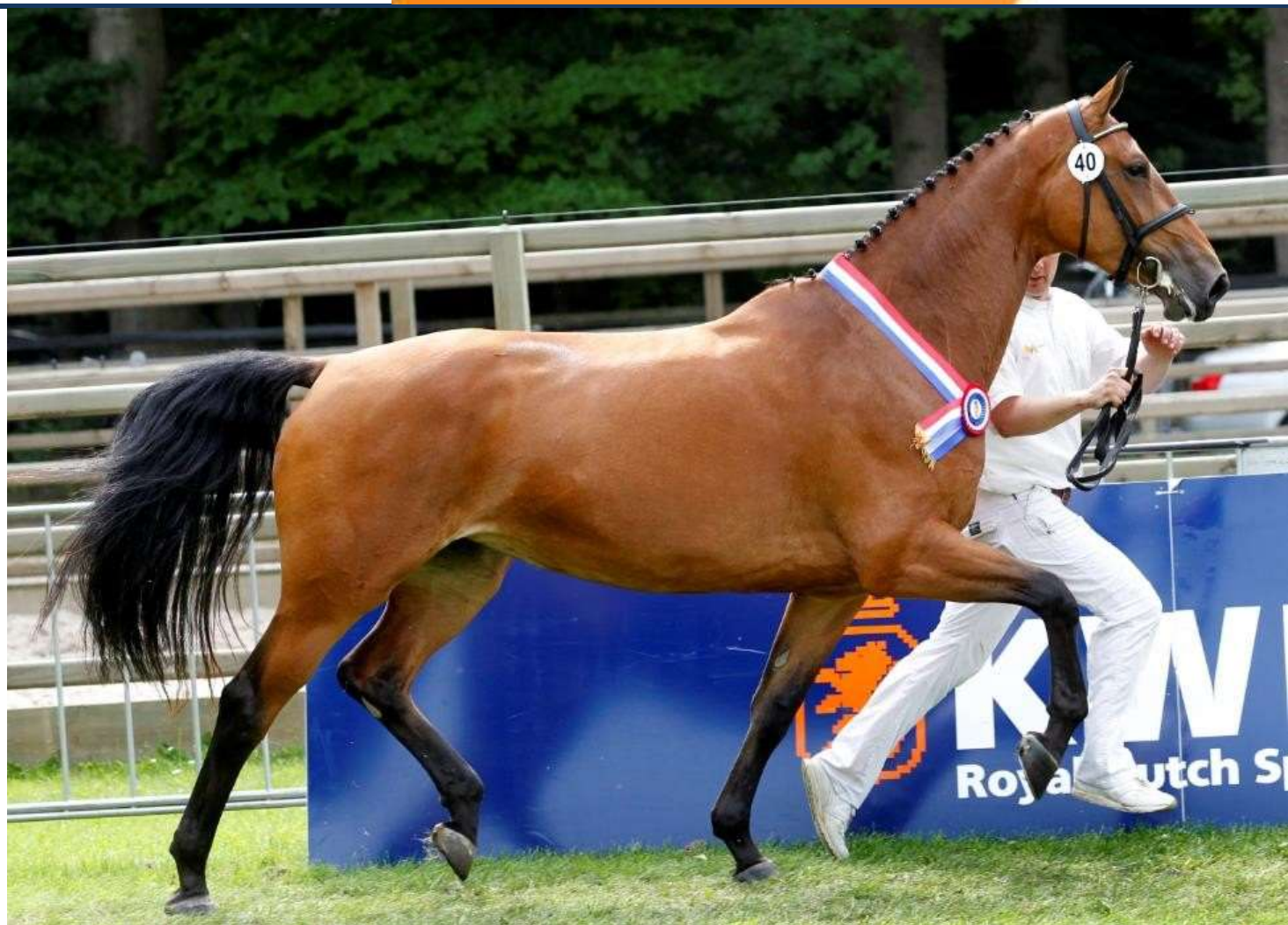
Jillz S (Alexandro P x Jetset D)