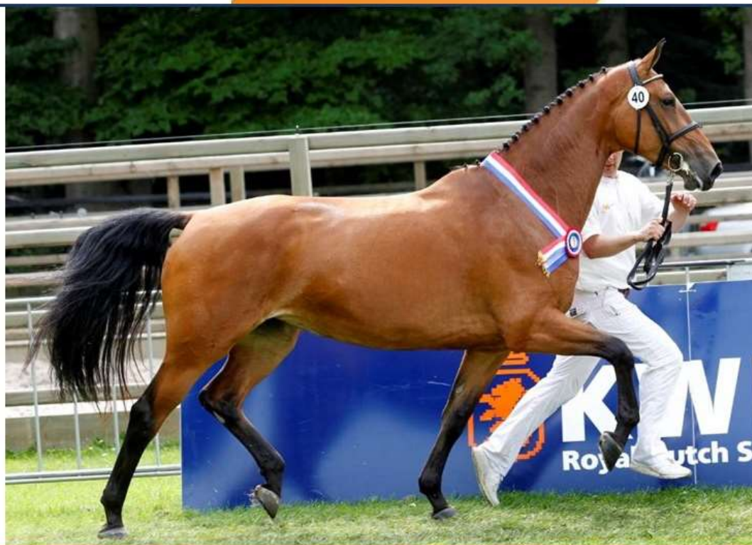
Jillz S (Alexandro P x Jetset D)