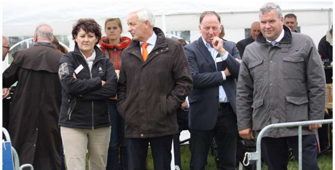
Een eigen mening- niet iemand die op de achtergrond alleen maar luistert 46