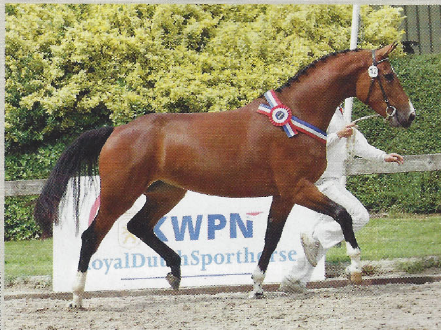
Een echte smaakmaker op de keuringen bleek Assivona (v.Numero Uno), die met 85/85 ster werd verklaard en het tweede product van Passivona op het NK vrijspringen was.