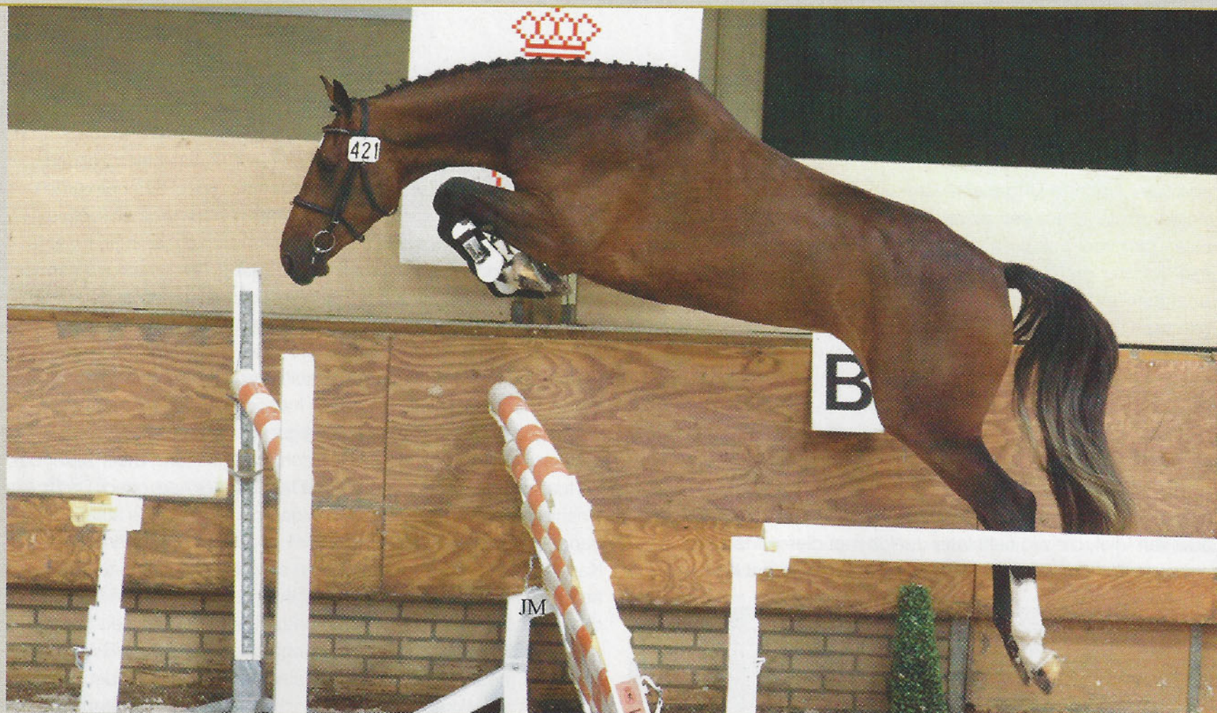
Vivona, de één jaar jongere volle zus van Unaniem, sprong als driejarige naar de achtste plaats op het NK vrijspringen, excelleerde in de IBOP en wordt bij de fokkers ingezet voor de fokkerij.