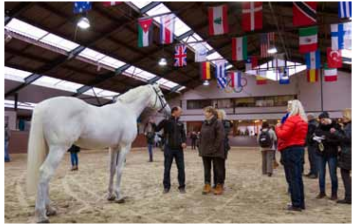
Bij de VDL Stud kwamen de deelnemers oog in oog met diverse beroemdheden, waaronder Cardento (foto) en de keurhengsten Corland, Indorado en Emilion. Ook de preferente Indoctro kwam in de piste, net als Quasimodo van de Molendreef en vele anderen.