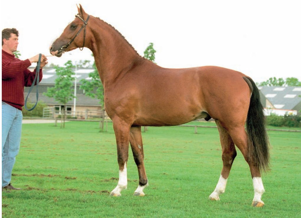
De negentienjarige preferente Koss heeft duidelijk zijn stempel gedrukt op het moderne Gelderse paard.

Koss komt zelf uit een bijzonder goed nest, waarin al generaties lang streng werd geselecteerd op kwaliteit. Zijn eerste veulens veroorzaakten een schokgolf onder de Gelderse fokkers. Ze liepen zonder uitzondering aan kop; moderne, rassige dieren met veel beweging en ruim voldoende Gelderse uitstraling. Onder zijn nakomelingen bevinden zich dan ook de nodige keuringskampioenen; kwaliteit is dus erfelijk! Naast topleverancier van keuringskampioenen heeft Koss veel fijne en veelzijdige sportpaarden gebracht. Zelf deed hij het ook heel verdienstelijk in de sport. Nadat hij was goedgekeurd, bracht zijn fokker hem bij de bekende dressuuramazone Christa Laarakkers. Met haar in het zadel was Koss een indrukwekkende verschijning in de dressuurring en doorliep moeiteloos de klasse Z2. Om de veelzij-