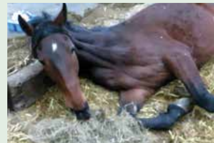
Merrie met EHV-1 kan niet meer staan, maar drinkt en eet nog volop.