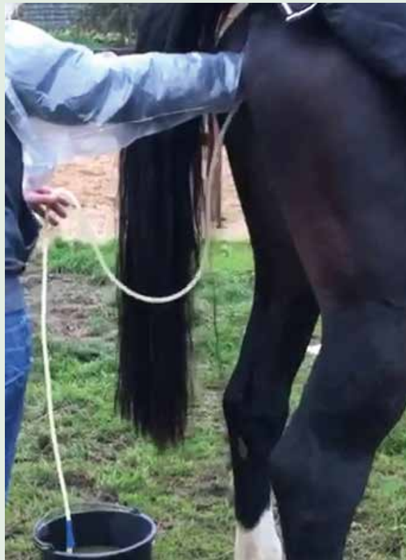
Urine catheteriseren bij dezelfde merrie op 26 oktober 2018.

Als het virus zich nestelt in de baarmoeder ontstaat er een vaatontsteking in de binnenste laag van de baarmoederwand en worden de placenta (moederkoek) en de vrucht afgestoten. Er volgt dan een abortus. De gevoeligheid van de baarmoederwand voor een dergelijke infectie is in het tweede deel van de dracht veel groter dan in het eerste deel van de dracht. Als het virus zich nestelt in het zenuwweefsel van ruggenmerg of hersenen ontstaat ook