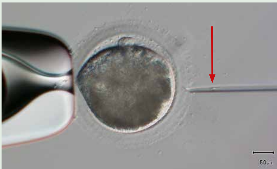
ICSI: de eicel wordt onder een microscoop aangeprikt met een holle naald waarin de spermacel (rode pijl) net te zien is.