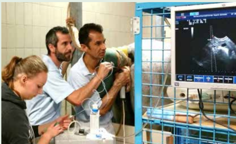
Voor OPU, het oppikken van de eicellen moet een team intensief samenwerken (foto van voor COVID19).

ICSI: de spermacel is in de eicel gebracht en nog net te zien (rode pijl) in het midden van de eicel.