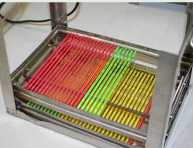
Rietjes met sperma staan klaar om te worden ingevroren.