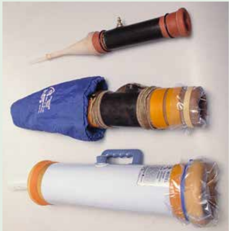
Diverse maten kunstschedes.

In vitro (d.w.z. in het laboratorium) productie van embryo's door middel van OPU/ICSI is de meest nieuwe voortplantingstechniek. Deze verschilt duidelijk van alle andere technieken aangezien de bevruchting plaatsvindt in het laboratorium. Momenteel is deze techniek heel populair bij fokkers, omdat het een aantal voordelen heeft. Zo kunnen er nog veulens 'gemaakt worden' van merries die niet meer drachtig kunnen worden (ten gevolge van afwijkingen aan de eileider, baarmoeder of baarmoedermond) of geen embryo's meer leveren bij een embryospoeling. Zowel fokkers als dierenartsen weten hoe frustrerend het kan zijn om merries te begeleiden die voortdurend vocht in de baarmoeder hebben of die keer op keer niet drachtig worden. Tevens kan OPU/ICSI het hele jaar door worden uitgevoerd zolang er maar voldoende follikels (onrijpe eicellen) aanwezig zijn op de eierstokken. Embryo's die met OPU/ICSI worden geproduceerd verdragen het invriesproces veel beter dan gespoelde embryo's. Dit heeft dan weer als voordeel dat draagmerries efficiënter gebruikt kunnen worden. Vaak worden de draagmerries zelf door de eigenaar aangeschaft wat financieel voordeliger is, omdat de huur van een draagmerrie natuurlijk wel